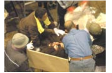
神武天皇が身につけていたものも次々と取り外され…↓