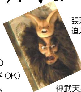
張飛翼徳の顔は近くで見ると迫力満点！桐箱にしまいます。