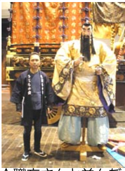
↑職方さんと並んだ劉備玄德。かなりの大きさです。この後2階のロビーに展示されました。

12月7日(月)、山車会館での展示山車の入れ替えを見学させて頂きました。(誰でも見学OK)飾りを外し、人形を降ろし、衣装をたたみ…、雛人形を片づけるときと同じですが、大きさが段違い！大の大人が何人もで、とりかかります。見ごたえがありました。有難うございました。(小林記)