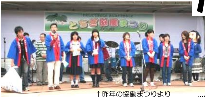
↑ 昨年の協働まつりより