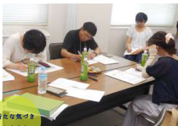
新たな気づきと出会う