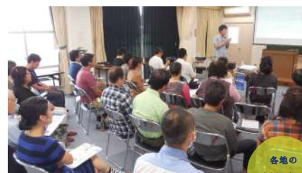
各地の事例を知る