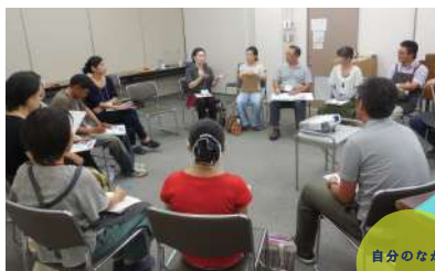
自分のなかの学びを深める