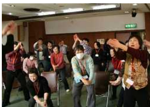
昨年度フォローアップ研修風景