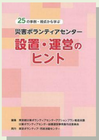
災害ボランティアセンター 設置・運営のヒント A5判 76P 税込 1,080円