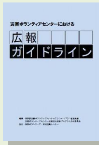
災害ボランティアセンター における広報ガイドライン A4判 60P 税込 540円