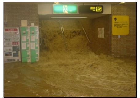
地下街に流れ込む雨水（2003年福岡水害）

ここ数年、都市部では突発的で予測の難しい豪雨災害が増えています。加えて、高齢化などによりますます難しくなる水害からの「避難」。