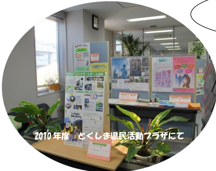
2010年度 とくしま県民活動プラザにて