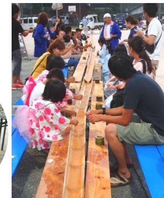
大盛況のそうめん流し!