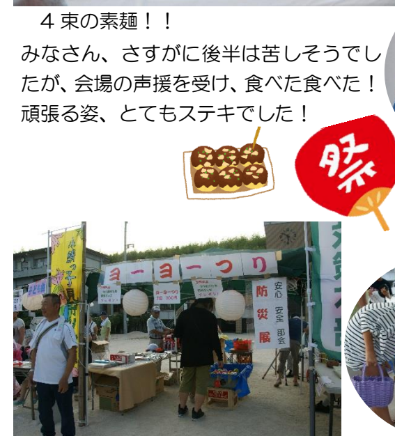
ヨーヨーつりは、子ども達に大人気でした★