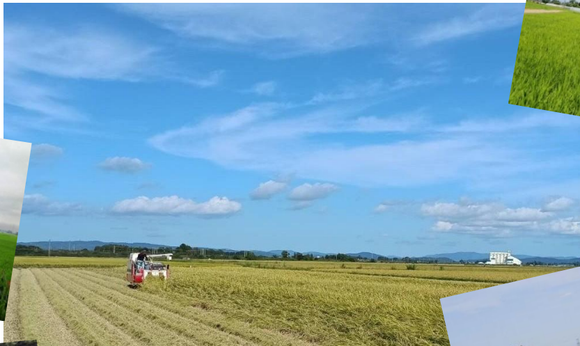
収穫の秋！大崎市の稲刈り