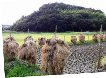
はまが 稲架掛け(棒かけ)の 利府町の田んぼ