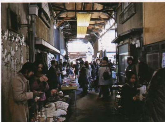
「松應寺横丁にぎわい市」では、参道に人々が行き交った