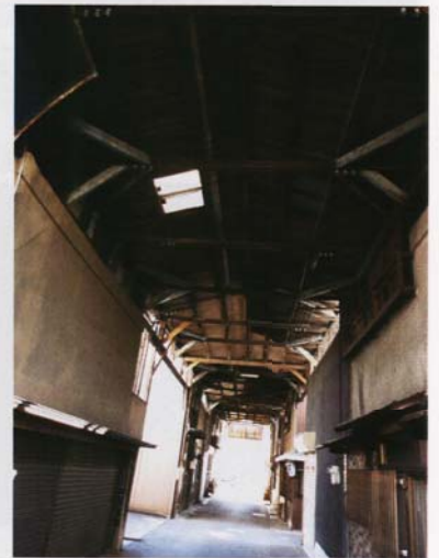
現役の木造アーケードが昭和空間を醸し出す

戦後、花町として栄えた松本町。活気に溢れた時代を駆け抜けたこの町には、昭和レトロな風情が今なお残る。昔の町並みを懐かしむ美しい情緒とは裏腹に、少子高齢化や空き家問題といった解決すべき課題も内包している。2011年11月26日(土)に行われた「松應寺横丁にぎわい市」。実に1000人を動員したこのイベントは、町を再生しようという意志を持った人々で構成された「松本町活性会議(通称:松應寺横丁にぎわいプロジェクト)」によって形作られた。松本町を新しいステージへと導くプロジェクト仕掛人による松本町座談会を敢行!