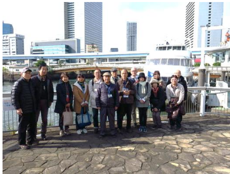
処分場視察 （大田区環境マイスターの会）