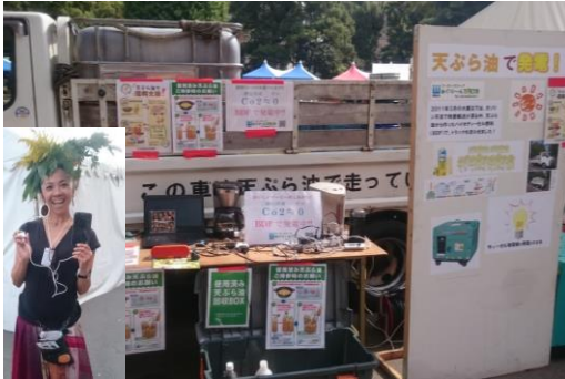
土と平和の祭典 2016 で「天ぶら油で発電」 実演中！（あぐり～ん TOKYO）