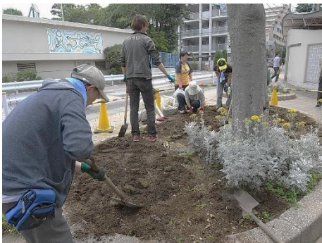
東調布公園での花壇植え替え作業 （NPO 法人色えんぴつ みどりの歩み）