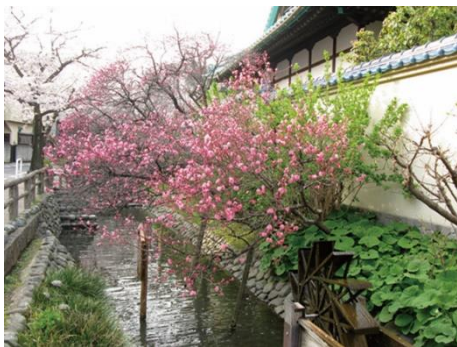
沼部の東光院脇、復元水路 （六郷用水の会）