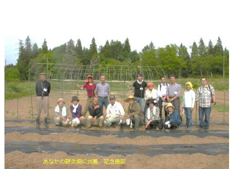
出張区民農園「あなたの野菜畑」 （昔ながらのトマトの勉強会）