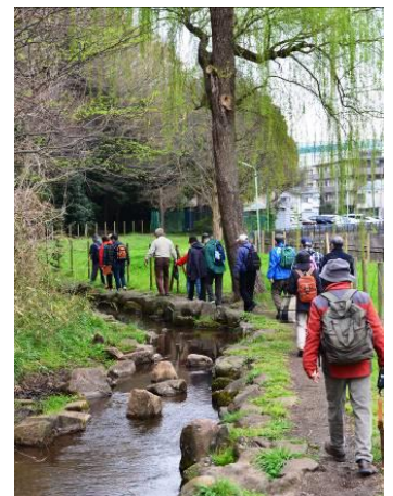
他河川ウォーキング調査 （呑川の会）