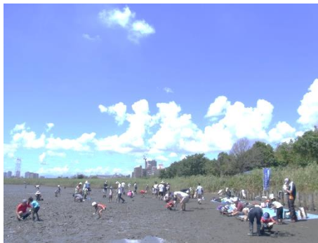
多摩川河口大師橋干潟の自然観察と保全活動 （多摩川とびはぜ倶楽部）