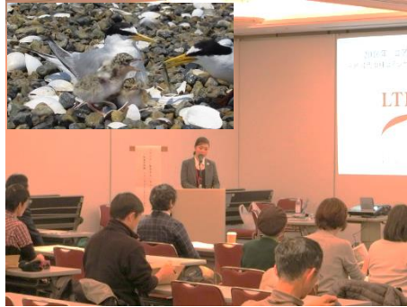
コアシサシの親子と、活動報告会 （NPO 法人リトルターン・プロジェク