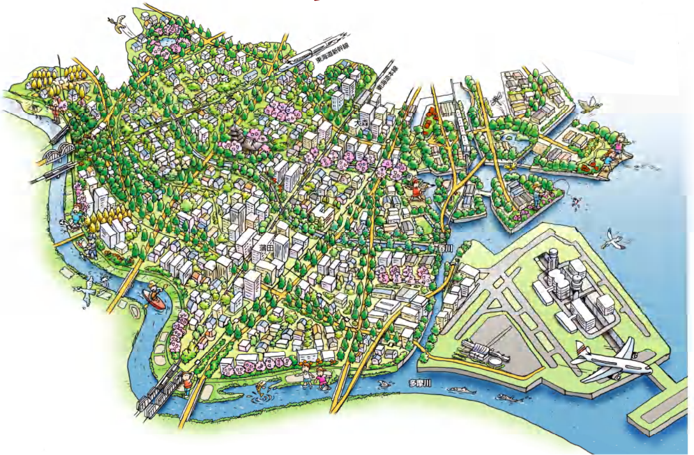
(仮称)大田区みどりの基本計画(素案)より