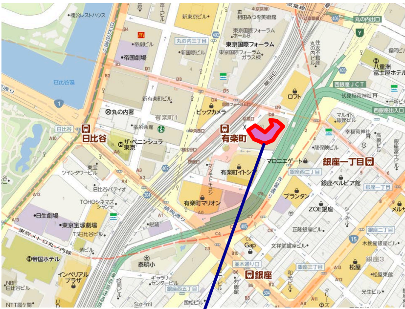
有楽町駅前広場(イトシア前)