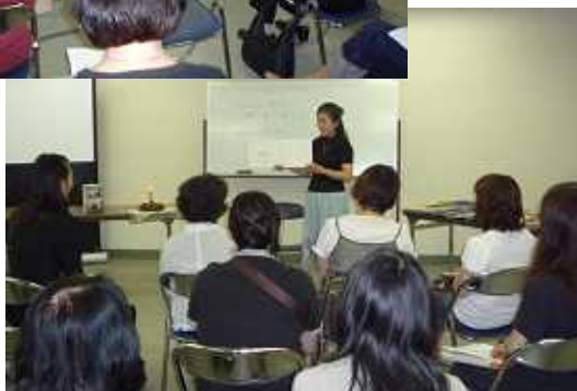
親子絵本作り講座