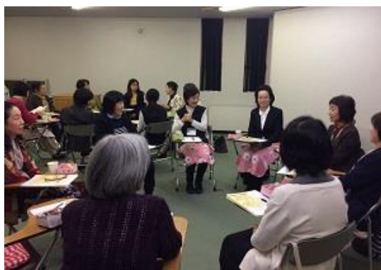
さくら市アリスの会との交流会より

・毎月第三水曜日 赤ちゃん向け（0～2歳） 今市図書館にて「プリプリおはなし会」開催中