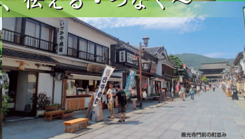
善光寺門前の町並み