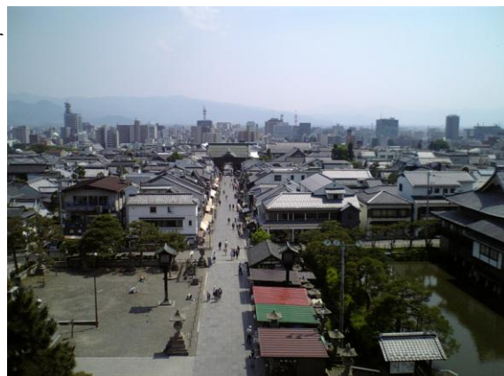
善光寺仲見世通り