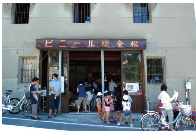
東町のリノベーション拠点「カネマツ」