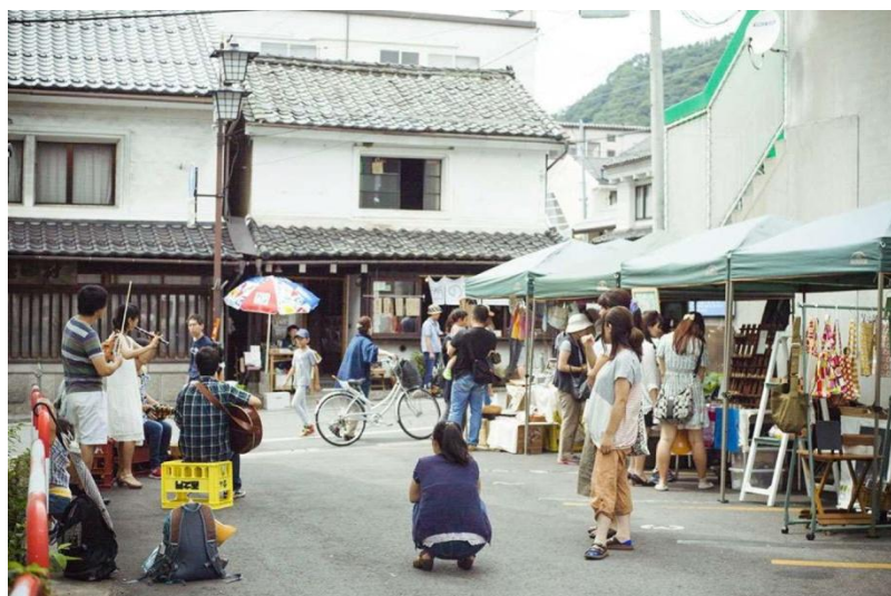
西之門市とナノグラフィカ