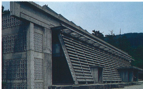
出雲大社庁舎[1963]・島根