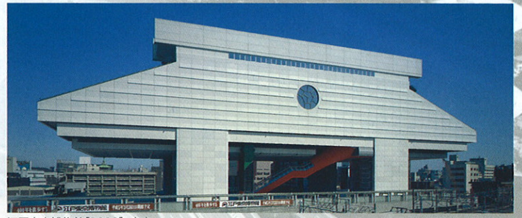
江戸東京博物館[1993]・東京

菊竹氏は盛岡において3つの建築設計に関わっており(岩手教育会館・旧盛岡グランドホテル・旧岩手県立図書館)、その思想は以後の景観形成や建築のあり方についても大きな影響を与えています。