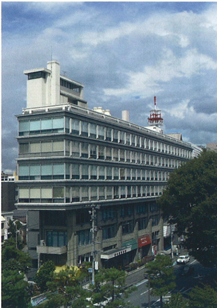
岩手教育会館[1965]・岩手