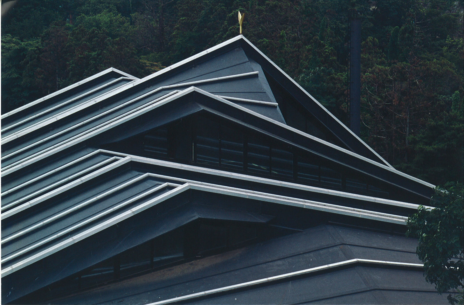
旧岩手県立図書館(現もりおか歴史文化館)