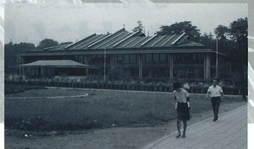
旧岩手県立図書館(現もりおか歴史文化館)[1967]・岩手