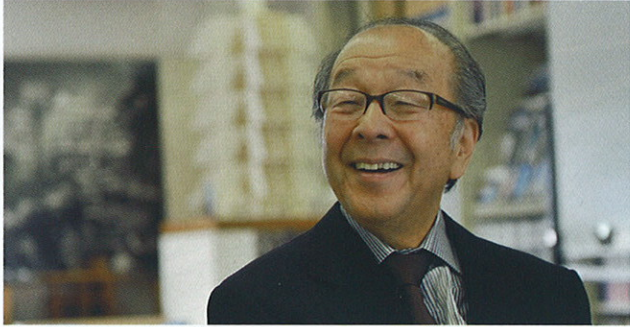
きくたけ きよのり 建築家/工学博士 菊竹清訓 (1928~2011)