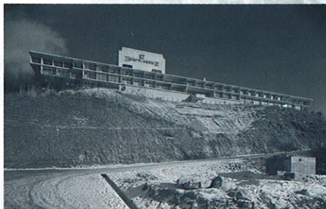
旧盛岡グランドホテル[1966]・岩手