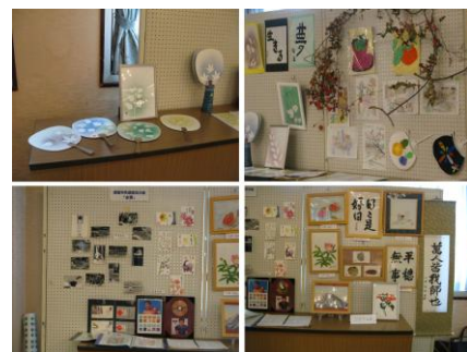
山梨の友の会の展示作品 全国大会の思い出集もありました

53名の皆さんに映画を見ていただきました。 和やかな雰囲気、楽しい交流ができました。