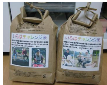
お土産に頂いた「いろは組」が投げ植えで作った貴重なお米