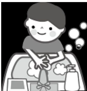
Lavarse las manos y hacer gárgaras!!