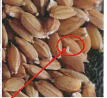
チョココンと出てるの分かりますか？小さい芽が出ています。発芽させる事によって、他の雑草よりもいち早く生育する利点があるそうですよ。