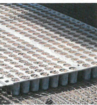
鎮圧作業により、土と育苗ポットの間に隙間が生じにくくなり、生育ムラが少なくなります。また、根巻きも良くなるんですよ。(ω)b