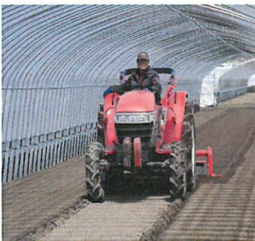
育苗ハウスの土を耕起しています。こうする事によって、空気や水の通りが良くなり、嫌気性の細菌が空気にさらされて死滅します。(ω)ホウ