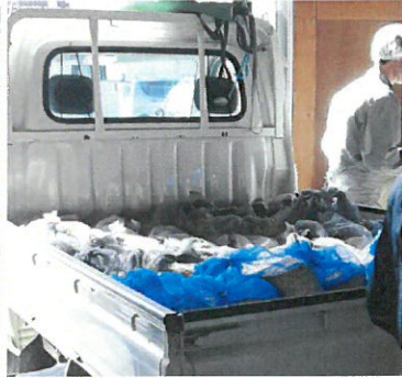
消毒された種もみは、生産者さんの元に。まだ寒い時期なので、毛布を掛けて運びます。(・∇・)へー