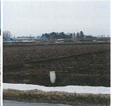
4月半ば、ようやく田んぼの雪がなくなりました。