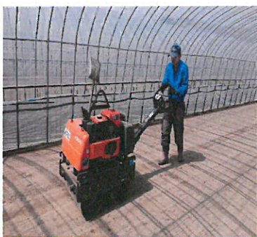
鎮圧育苗作業です。耕起した土を鎮圧ローラーで、歩いても足跡がつかなくなるくらいまで踏み固めていきます。土が固まると、この後の作業が楽に♪