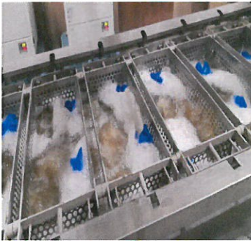
今年もこの時期がやってきました、温湯消毒！農薬使用量を半分以下に抑える大切な作業の一つです。