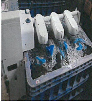
種もみは、1週間～10日10℃～12℃の水に浸し、その後24時間30℃～32℃の食酢の入ったお湯で催芽します。