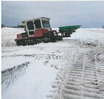
雪の上をどんどん進んでいきます。