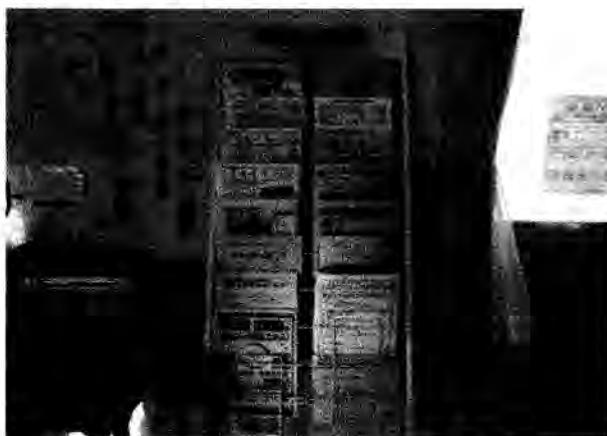
国府多賀城駅南地区仮設住宅のチラシラック

チラシラックについて不明な点、お気づきの点があれば、たがさぼまでご連絡ください。