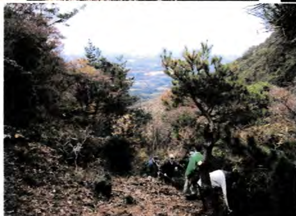
倉部山、三国山中間地点から 奥余野三馬谷に至る 登山道の刈り開け状況