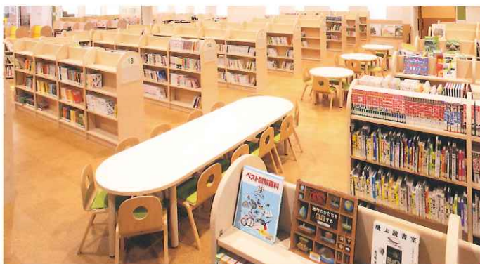
児童コーナー 絵本や読み物が約3.5万冊。児童専用のカウンターがあります。