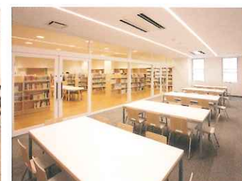
グループスペース 2 [要申込] 小学生までの社会科学見学や調べ学習に利用できる部屋です。