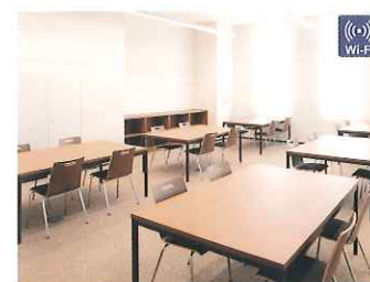
グループスペース 1 [要申込] 図書館資料を利用して、調査・研究するための部屋です。