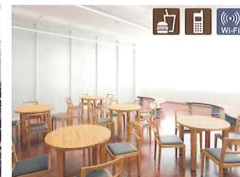
サンプルーム 飲食や待ち合わせなどにご利用ください。