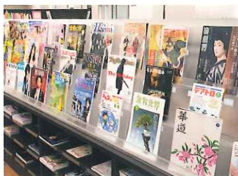
雑誌・新聞コーナー 約200タイトルの雑誌と各種新聞を読むことができます。