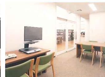
対面朗読室 障がいをお持ちの方等へ資料の検索やその他のお手伝いをします。