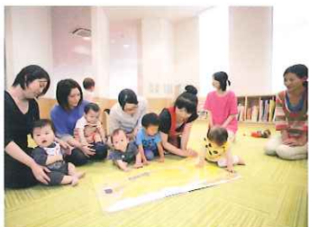
なかよしひろば 乳幼児が楽しめる、大型絵本などがあります。自由に利用できます。