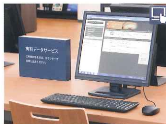
有料データベース端末 [要申込] 法律や新聞記事等調べものに役立つデータベースを利用することができます。