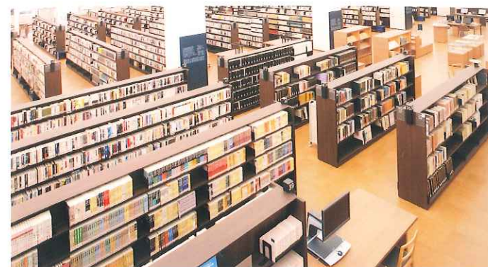
一般コーナー 入門的なものから、大学生や社会人の調査・研究に役立つ専門的なものまで、各分野の資料を幅広く収集しています。