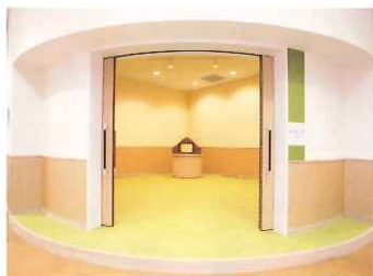
おはなしのへや 定期的に職員やボランティアによるおはなし会や読み聞かせを開催しています。