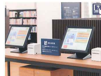
資料検索機 9台 総合カウンター前と各エリアに図書館資料の検索ができる端末があります。