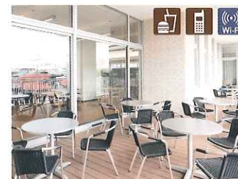
読書テラス 陽が降り注ぐ広々としたデッキで読書ができます。飲食も可能です。