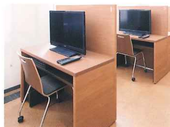
視聴覚コーナー 4台 [要申込] 図書館のCDやDVDを視聴することができます。