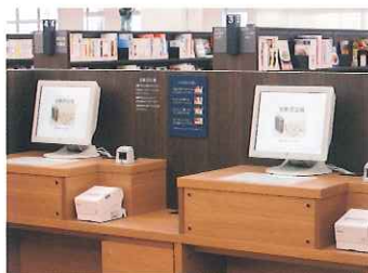
自動貸出機 3台 借りたい資料をテーブルの上に置き、貸出資料数を入力するだけで簡単に手続きができます。