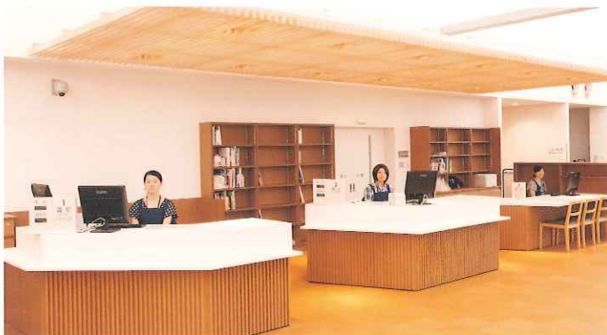
総合カウンター 図書の貸出・返却・予約・利用者登録受付・施設の申込などの総合窓口です。