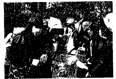
地域との合同防災訓練で中学生に「地域の担い手」を意識させる取り組み(稲城市立第五中学校)