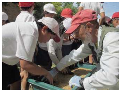
★ニジガハマギクのさし芽