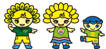
あさエール あさらぶ あさまも